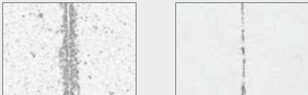
Abbildung: Trockenschnitt gegenüber Zuschnitt mit zugeführter Schneidflüssigkeit Silberschnitt® V55