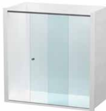
Fal-fal közötti beugró kivitel